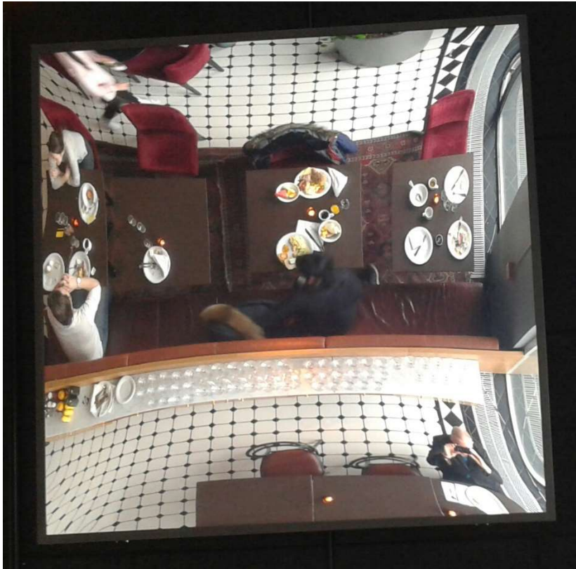
Hotellfrukost på Elite Stadshotell, Eskilstuna 18 februari 2018